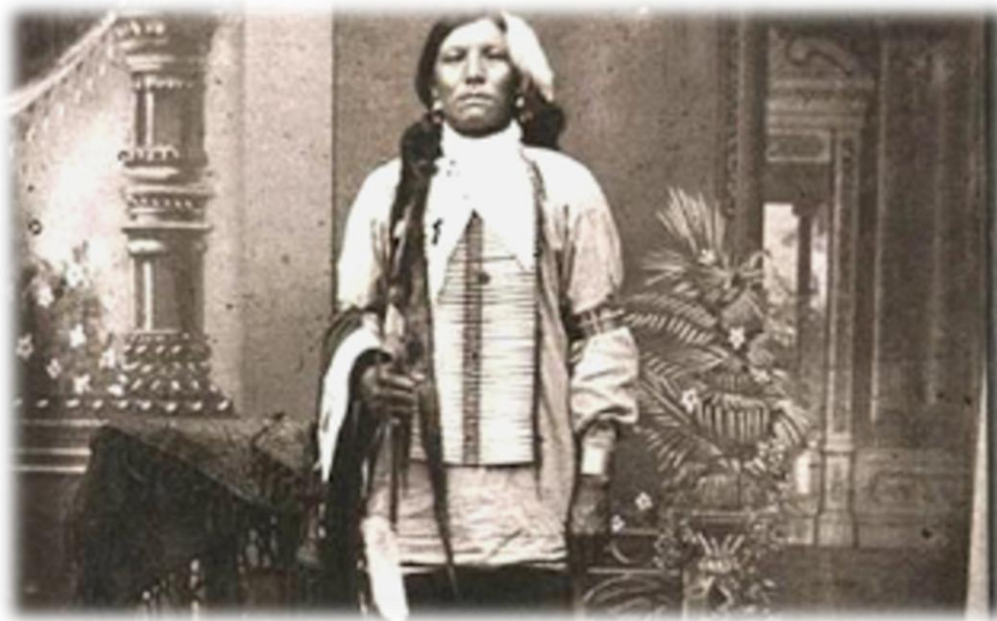
Ο τελευταίος αρχηγός των Λακότα Σιου ( Τρελό άλογο)

https://www.youtube.com/watch?v=nUumFMoMdmY