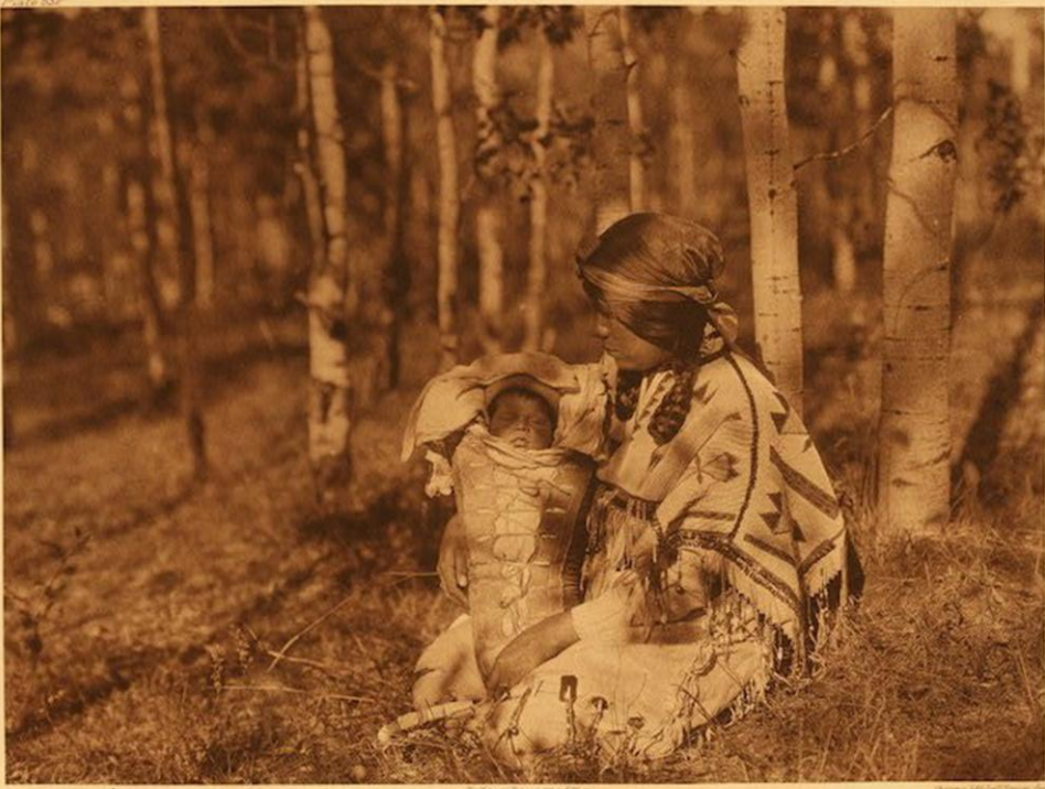
ARIZONA MOTHER AND CHILD