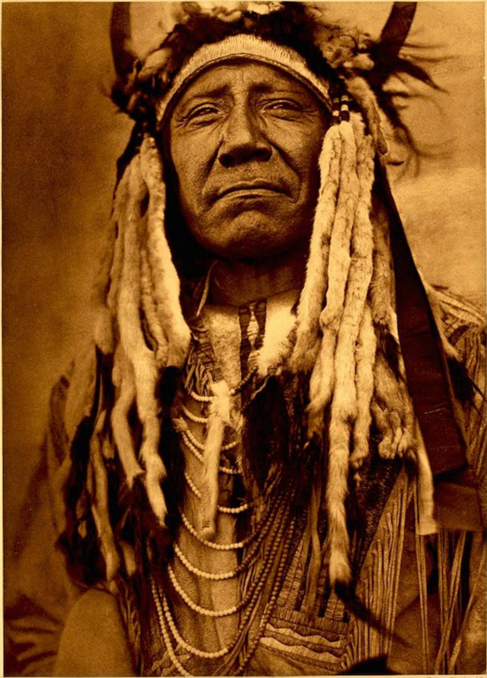
TWO MOONS - CHEYENNE