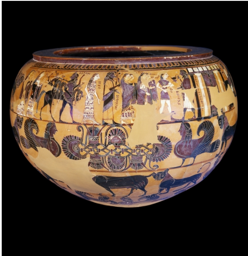
η τελετή του γάμου