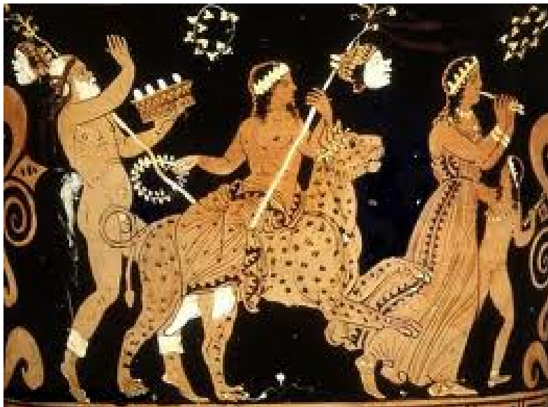
η νύφη οδηγείται στο γαμπρό