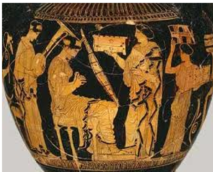
η προετοιμασία της νύφης