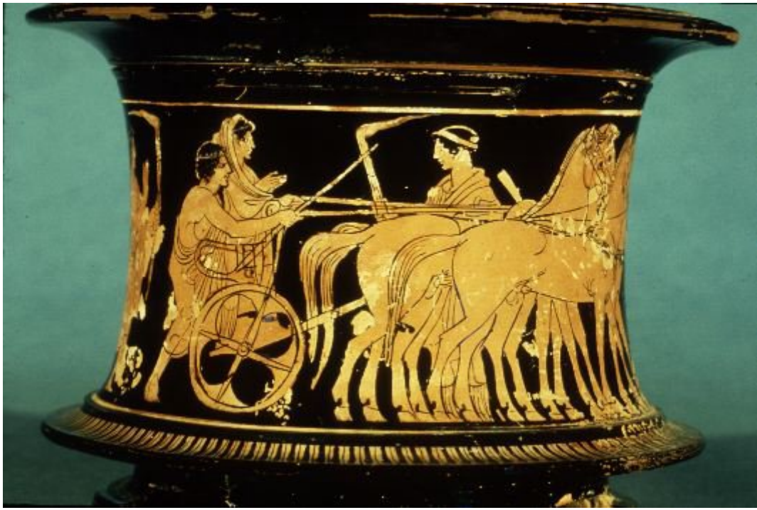
αγγείο που απεικονίζει την πορεία της νύφης στο γαμπρό