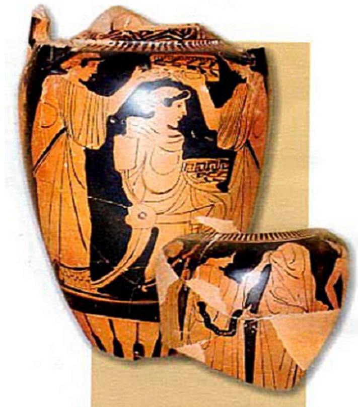
η προετοιμασία της νύφης