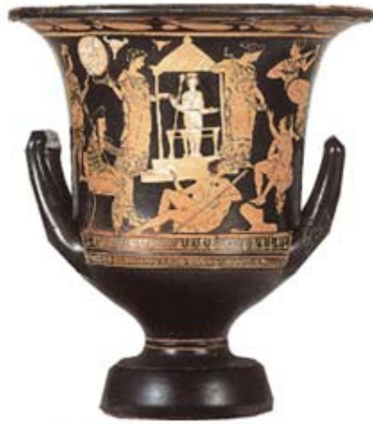
η προετοιμασία της νύφης