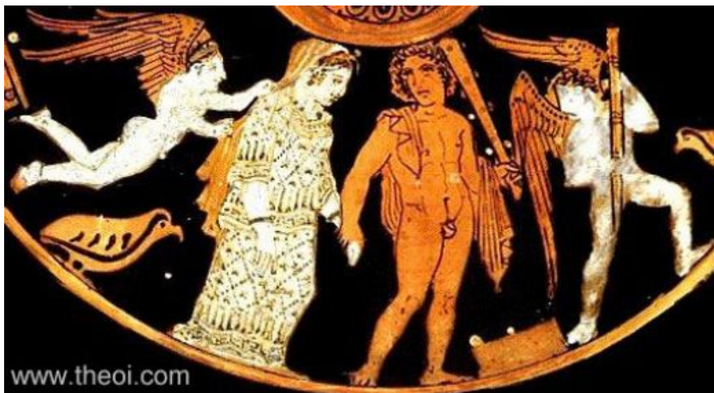
η πορεία της νύφης