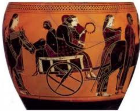
η πορεία της νύφης