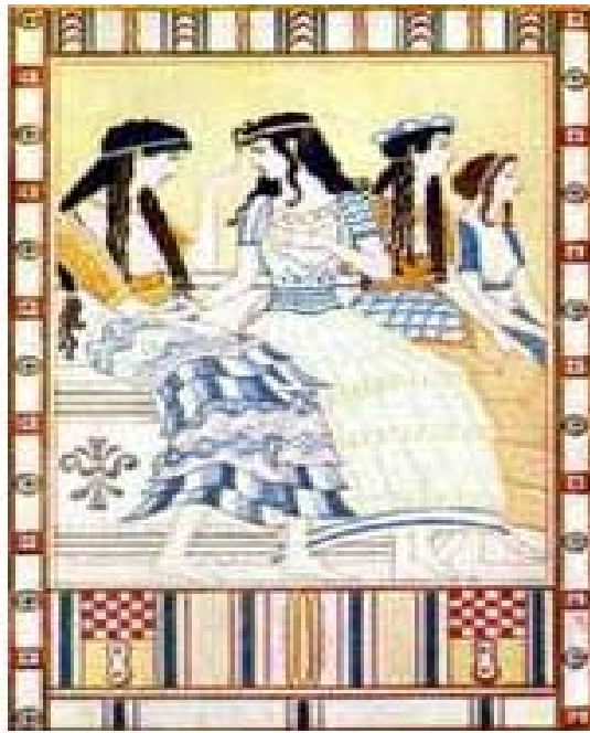
η ετοιμασία της νύφης από τις φίλες της