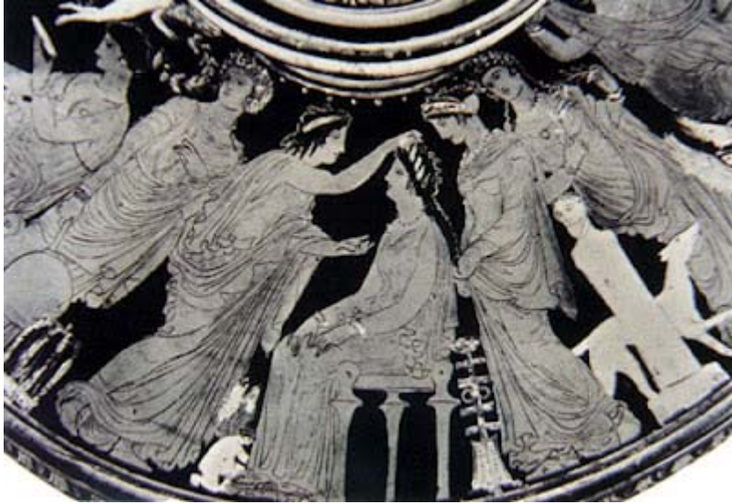
προετοιμασία της νύφης